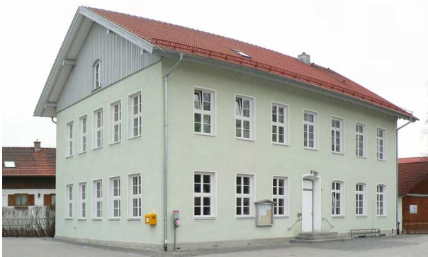
Unser Domizil. Die „Alte Schule“ in Bertoldshofen

Die aktuelle Mitgliederzahl der Schlossbergler Schützen e.V. zum Stand 1. Januar 2011 beträgt 124, davon sind 57 Mitglieder unter 26 Jahre, 46% der Gesamtmitgliederzahl. Seit einem Jahr laufen die Vorbereitungen für das traditionelle Gauschützenfest, das im Juni und Juli 2011 mit einem abwechslungsreichen Begleitprogramm stattfinden wird.